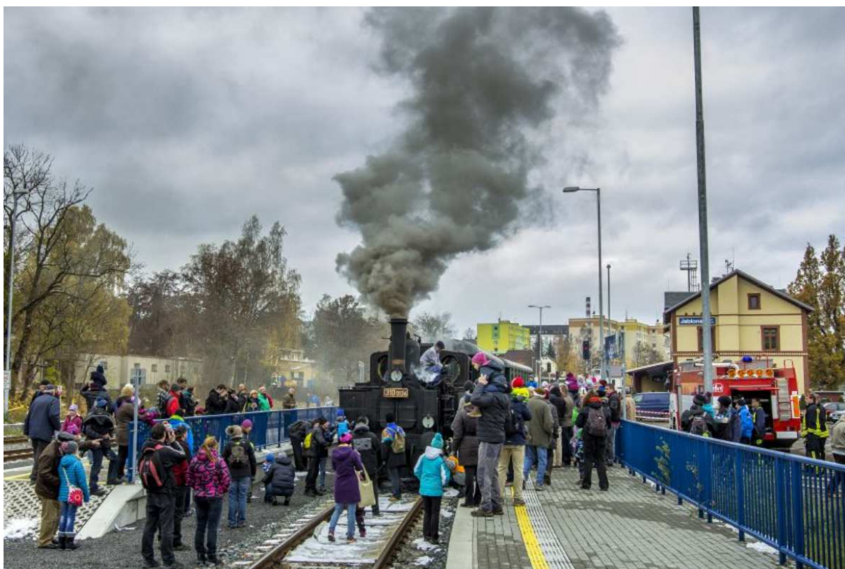
Z akce „Pára patří minulosti“ – sobota 15. listopadu 2016

Společnost přešla v roce 2014 z účtování v hospodářském roce na účetní období kalendářního roku. V tomto stavu setrvává společnost až do současnosti a nepředpokládá do budoucna změnu.