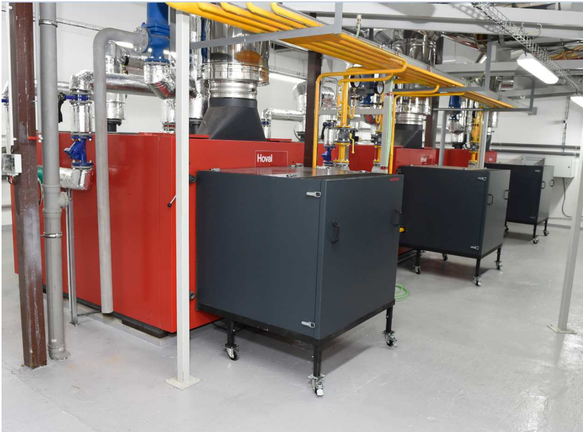
Zdroj Z4 ulice Březová, sídliště Šumava

Valná hromada Společnosti rozhodla na svém zasedání dne 27.6.2013 o snížení základního kapitálu z 301.000.000 Kč o 150.500.000 Kč na 150.500.000 Kč a to formou snížení nominální hodnoty na 50%. Záměr tohoto snížení byl předán na Rejstříkový soud a rovněž byl zveřejněn v Obchodním věstníku. Byly zpracovány dva nezávislé odborné posudky, osvědčující, že splatnost pohledávek věřitelů, které vznikly ke dni předcházejícímu zveřejnění tohoto záměru v Obchodním rejstříku, nebudou ohroženy. Společnost dále v procesu jednání s Rejstříkovým soudem nechala zpracovat auditorskou zprávu, která pozitivně potvrdila uspokojení předmětných pohledávek. Dne 25. listopadu 2013 provedl Rejstříkový soud příslušnou změnu osvědčující snížení základního kapitálu. Peněžní vypořádání finančního dopadu snížení základního kapitálu proběhlo v souladu se smlouvou o převodu akcií mezi MVV Energie CZ, Statutárním Městem Jablonec nad Nisou a společností dne 5. prosince 2013.