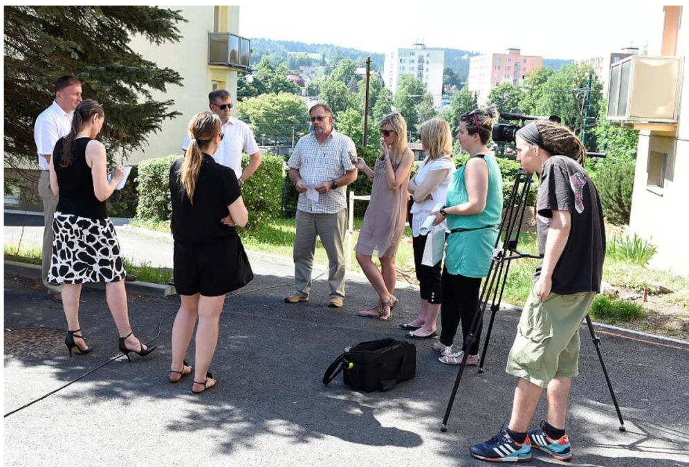
Setkání s novináři – informace o průběhu Revitalizace