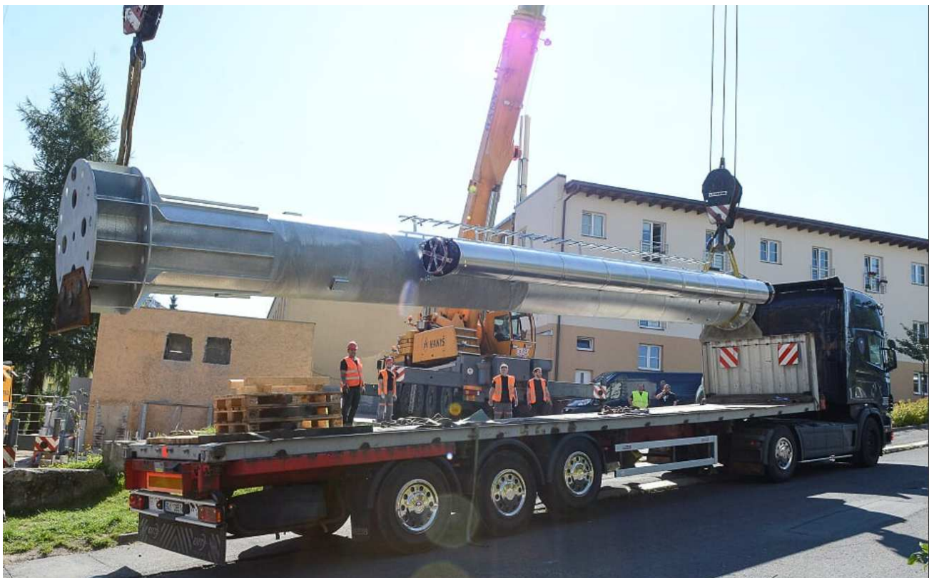
Doprava a umístění komínu pro zdroj v ulici U Balvanu

Současně došlo k odstavení příslušných rozvodů páry a kondenzátu, čímž došlo ke snížení tepelných ztrát rozvodů.