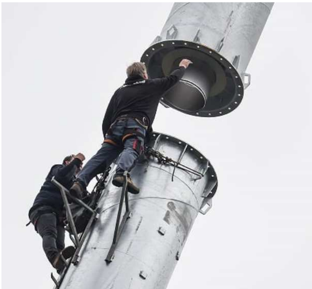
Montáž komínu – Zdroj Žižkův vrch