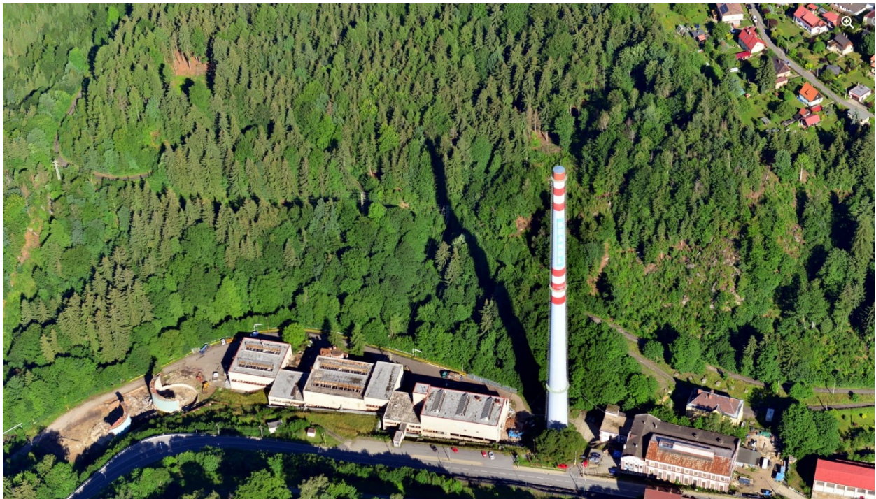
Pohled z dronu na výtopnu Brandl před její demolicí 25.9.2021