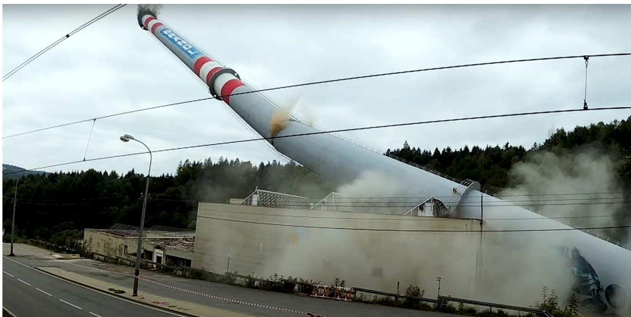
Pohled na padající komín výtopny Brandl z ulice Liberecká

Odstavením příslušných rozvodů páry a kondenzátu došlo ke snížení tepelných ztrát rozvodů.