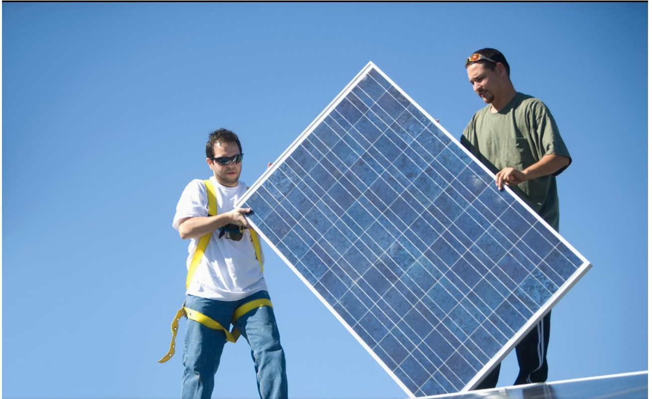
Montáž fotovoltaických panelů na zdroji Z9 Boženy Němcové

Společnost využívá všech zákonných prostředků v rámci péče o životní prostředí a maximálně se věnuje postupům zabráňujícím poškození životního prostředí způsobené její činností.