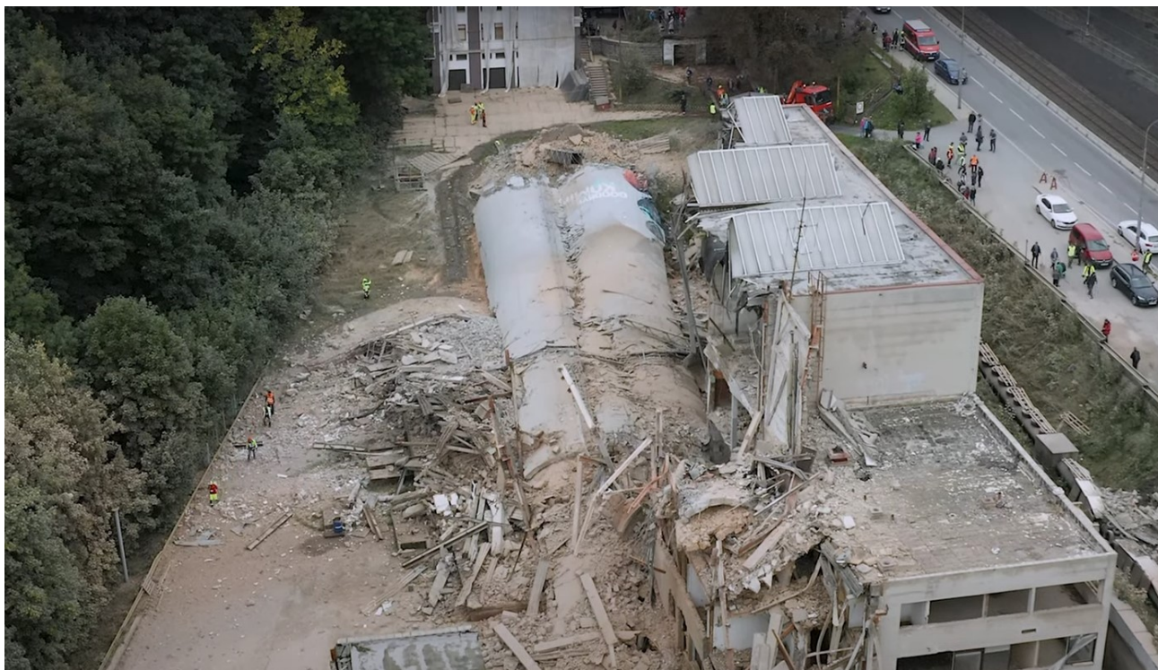
Trosky budov výtopny Brandl po pádu komína

Společnost dále podporuje hnutí bezpříspěvkového darování krve a krevní plazmy.