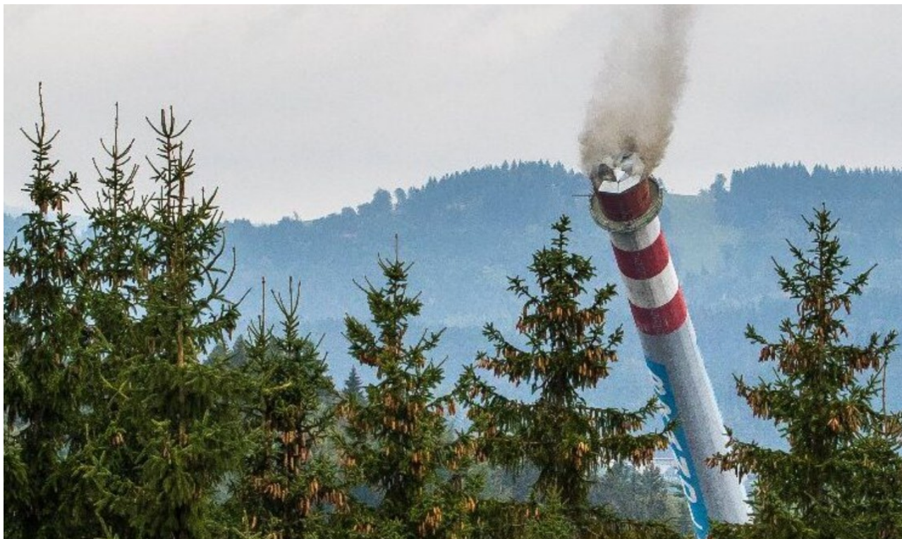
Pohled na padající komín výtopy Brandl od severu

Revitalizace – individuál - odběratelé se smluvní cenou tepla