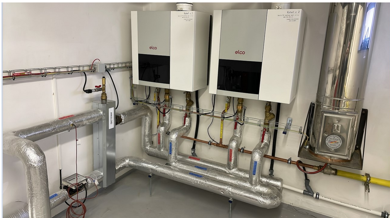
Jedna z plynových kotelen převzatých od Města Jablonec n/N v roce 2021

Společnost prodala významnou část volných emisních povolenek v celkovém množství 51.000 kusů v celkové ceně 105.102 tis.Kč.