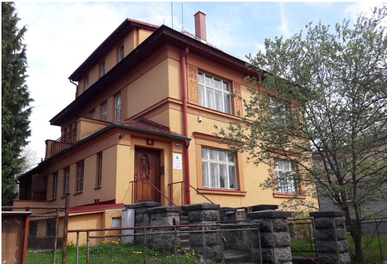
Nové sídlo společnosti: U Rybníka 2402/5, Jablonec nad Nisou

Valná hromada Společnosti rozhodla na svém zasedání dne 27.6.2013 o snížení základního kapitálu z 301.000.000 Kč o 150.500.000 Kč na 150.500.000 Kč, a to formou snížení nominální hodnoty na 50 %. Záměr tohoto snížení byl předán na Rejstříkový soud a rovněž byl zveřejněn v Obchodním věstníku.