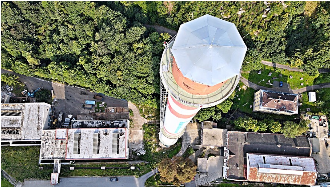
Detail ochranné střechy komínu Brandl před zbouráním