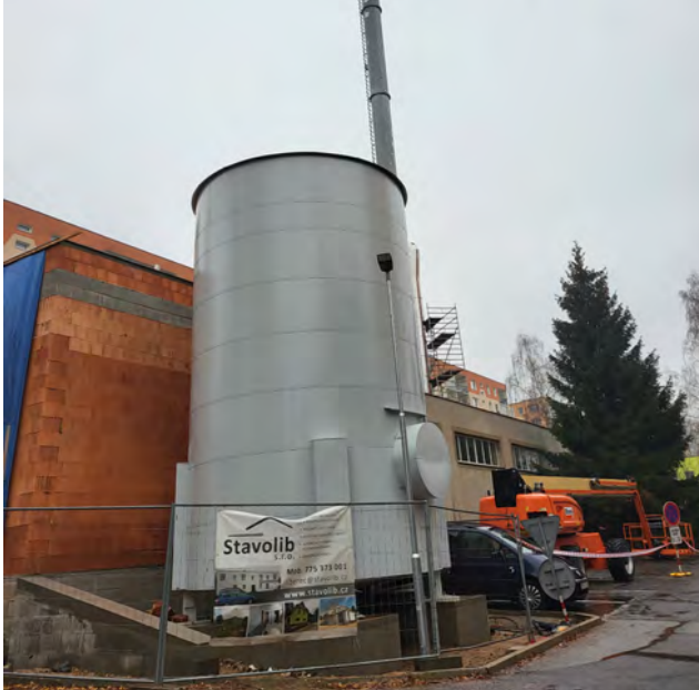
Stavební práce v Mechově