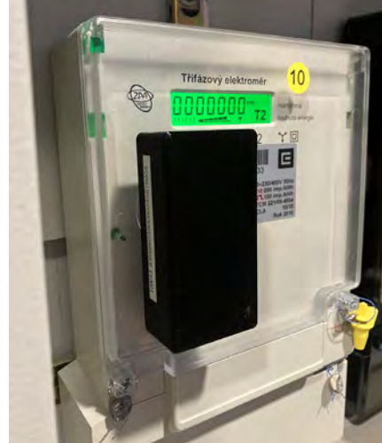
Instalace optických snímačů

Současně využíváme průběhová měření od distributorů elektřiny a vody, a spolu s vlastním měřením tepelné energie optimalizujeme nejen spotřebu, ale jsme schopni rychle reagovat na případné nesrovnalosti a odchylky od normálu.