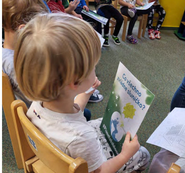
Díky omalovánkám si děti zopakují, co se naučily