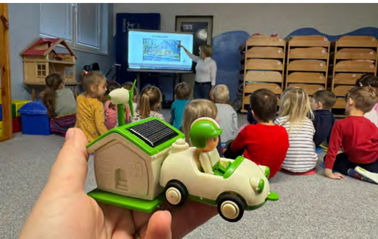
Každá třída dostává od Nadace Jablonecká energetické autíčko na solární pohon